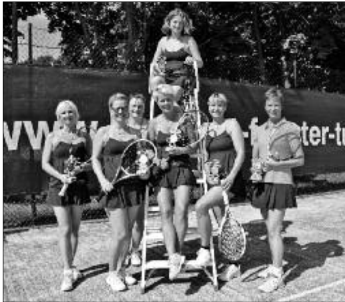
Meisterhaft und Charmant: Die Damen des TC Flöha-Plaue wurden Kreismeister und stiegen dadurch in die Tennis-Bezirksklasse auf.

schule. Das Training der Erwachsenen findet immer mittwochs ab 17 Uhr statt. (kbe)