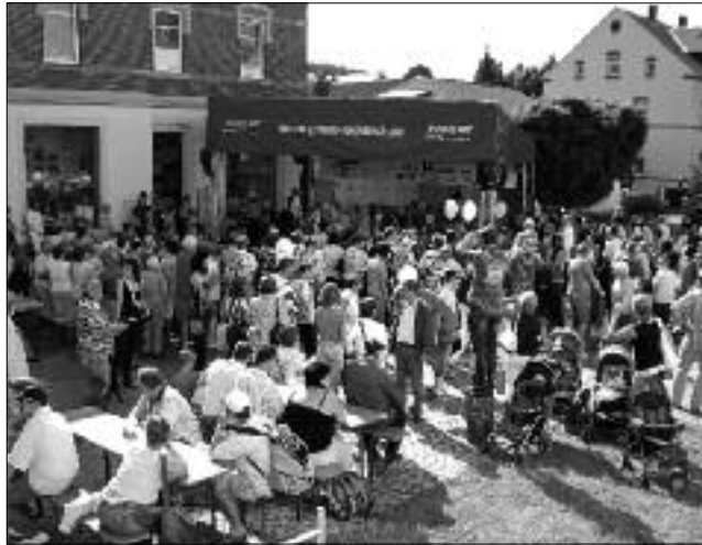
Großes Gedränge zum alljährlichen Straßenfest entlang der Rudolph-Breitscheid-Straße und vor allem vor der Hauptbühne mit vielen abwechslungsreichen Programmhöhepunkten.

Am 30. August ist es wieder so weit. Der Gewerbe- und Festverein Flöha e.V. hat sich auch in diesem Jahr wieder etwas einfallen lassen, um die Tradition des Straßenfestes in Gedenken an das Hochwasser 2002 aufleben zu lassen. Gemeinsam mit den Vereinen und Unternehmern der Region wurde ein abwechslungsreiches und unterhaltsames Programm zusammengestellt. Von 14 bis 22 Uhr laden zahlreiche Stände zum Spielen, Genießen und Verweilen ein. Besonders auf unsere kleinen Besucher warten Entenangeln, Ponyreiten, Zielspritzen, Malen & Basteln, Hüpfburg & Karussell, Glücksrad, Solarautos und vieles mehr. Außerdem wurden eine Kinderartikelbörse, ver-