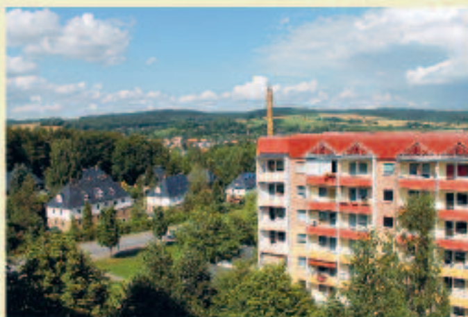
herrlicher Blick in die schöne Umgebung

Interesse geweckt? Rufen Sie Frau Barth an! Tel. 03726 589922