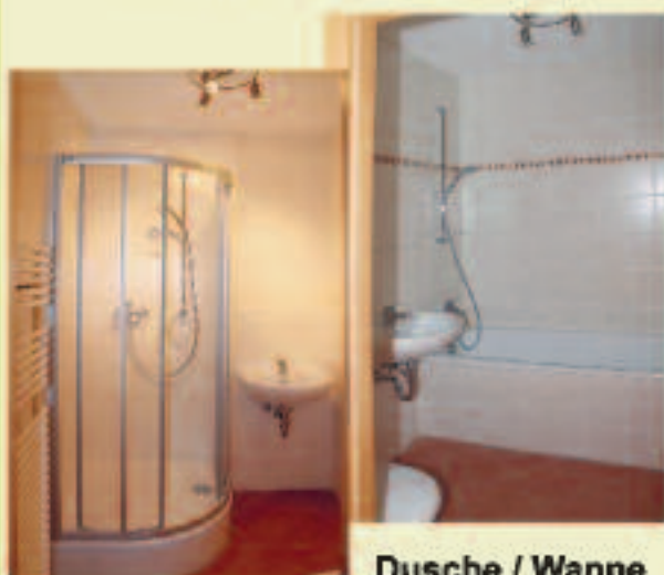
Dusche / Wanne