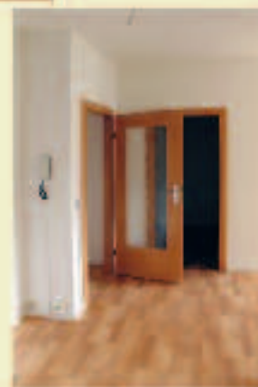
Hochwertige Türen und Fußböden