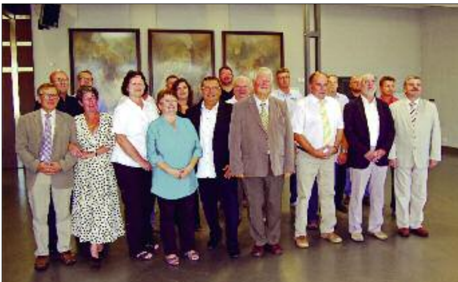
Die neuen Stadträtinnen und Stadträte des Stadtrates Flöha zur ihrer konstituierenden Sitzung am 17. Juli 2014